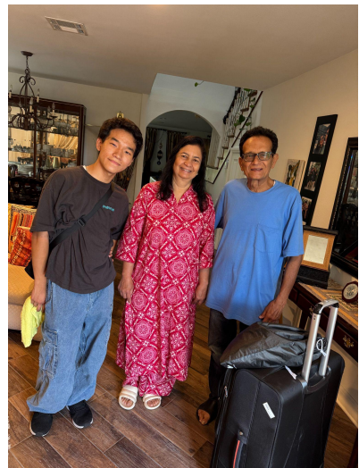
2023年トビタテ医療ボランティア生