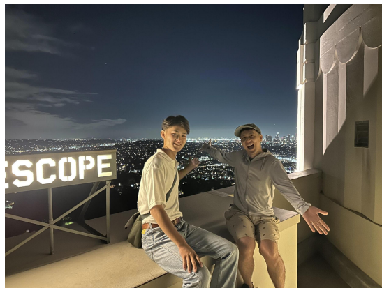
グリフィス天文台の夜景