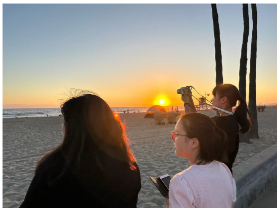
カリフォルニア西海岸の夕日