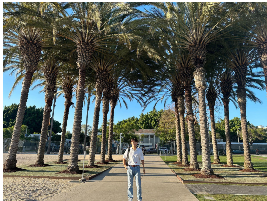
オレンジカウンティのヤシの木