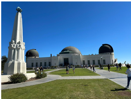
グリフィス天文台の正面

土日の休日は、自由時間です。ホストファミリーと出かけたり、友達同士で出かけたり、ショッピングやスポーツなど、好きなことをして過ごしてください。西海岸には沢山の観光スポーツや有意義に過ごせる場所があります。