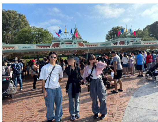
ディズニーランド