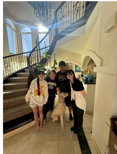
2025年留学USA医療ボランティアに参加したトビタテ留学生